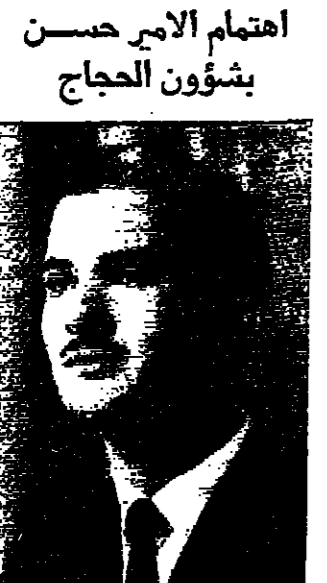
عنان - تشرف بقابلة سمو الامير حسن ولي العهد المظفر قبل ظهر امس رئيس واعضاء لجنة شؤون الصح الرسمية . البقية على الصفحة الخامسة عمود ٦

القديس - ( خاص بالمشور ) نشرت جريدة (الاتحاد) التي تصدر باللغة العربية في اسرائيل هذا الاسبوع ان هناك اجابا عاما لدى السلطات الصهيونية على نضل المهمة التي كلف بها (موتشه ساسون) مساعد رئيس الوزراء للشؤون العربية ، والقاضي بجس نبض السكان العرب في الضفة الغربية حول مدى استعدادهم لقبام البقية على الصفحة الخامسة عمود ٢